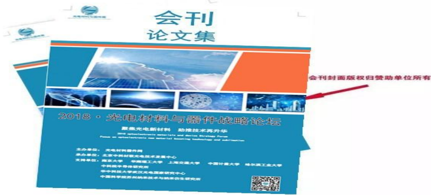
论文集及会刊广告（封面、封底）